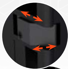
Verstelbare hulpschoot opvang