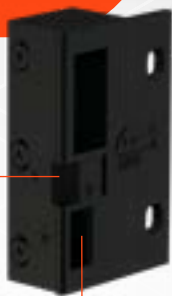
Hulpschoot - automatische trigger t.b.v. nachtschoot