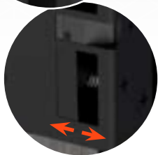
Verstelbare rolschoot opvang